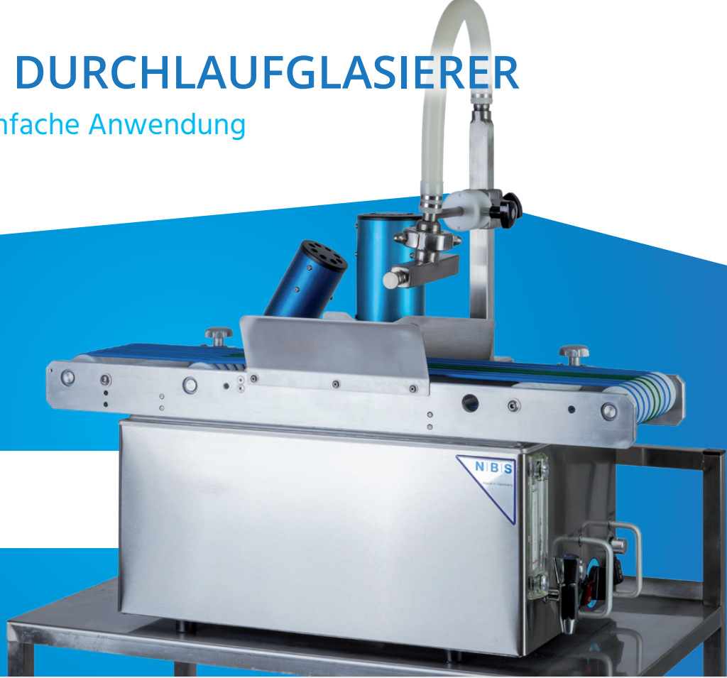
Abbildung enthält Sonderausstattung

Der Junior Tisch Bandglasierer ist unsere Kompaktlösung für gleichmäßig veredelte Backwaren in Konditorqualität. Er ist einfach zu bedienen, flexibel einsetzbar und ideal für handwerklich arbeitende Bäckereien und saisonale Aktionsprodukte geeignet.